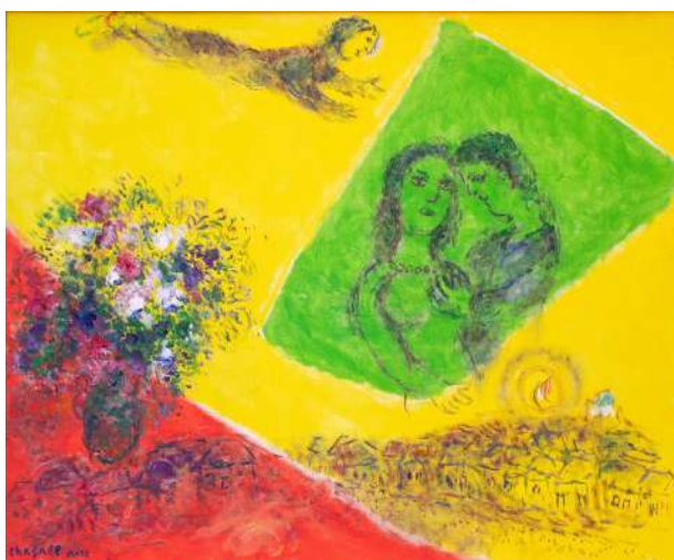
Marc CHAGALL Les amoureux au carré vert , circa 1970 - 1975 Huile sur toile Adjugée 14 979 000 MAD / 1 430 629 € frais inclus

La passion de Marc Chagall pour la couleur a été mise à l'honneur avec Les amoureux au carré vert , adjugé à 14 979 000 MAD / 1 427 00 € frais inclus.