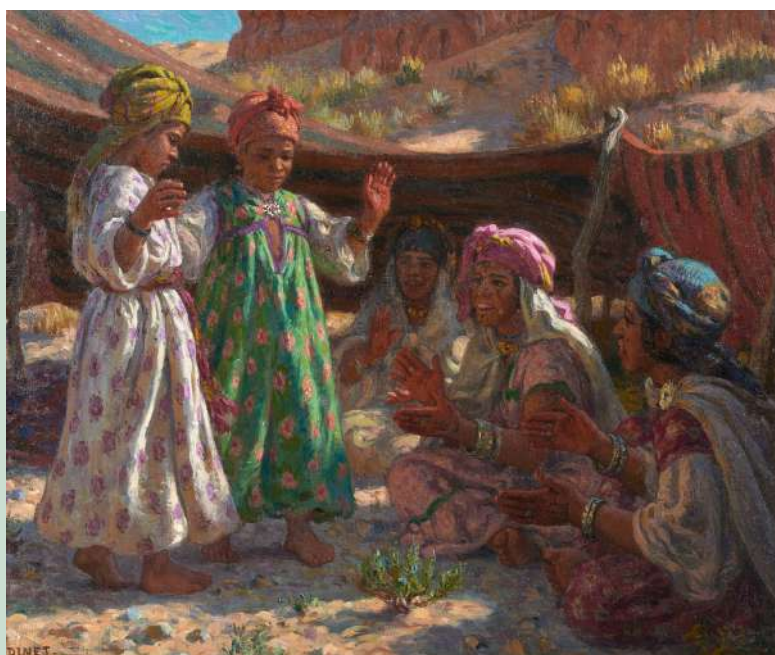
Etienne DINET Fillettes dansant , 1911 Huile sur toile Adjugée : 3 571 000 MAD / 341 063 € frais inclus